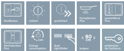
Table à induction avec de nouvelles fonctions innovantes, pour une grande flexibilité en toute situation.